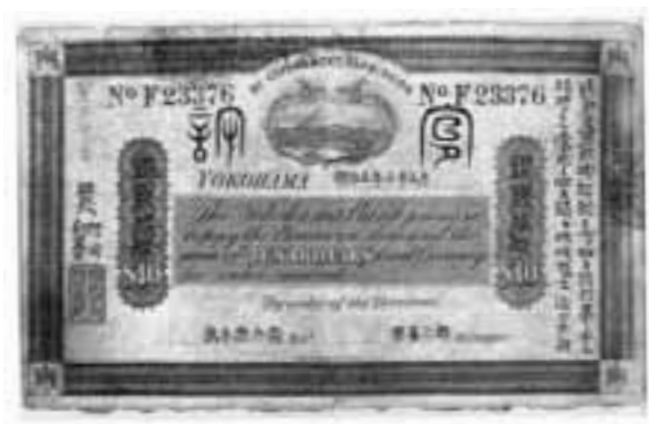
図表-8 横浜為替会社発行の洋銀券

このことは注目されるべき点である。つまり、商品の取引が一方で行なわれていて、それに対して金融が同時に行なわれるのだから、そこで支払機能を持つ手形あるいは貨幣を頻繁に発行すれば、産業振興策としてももっとも効率的で効果的な方法が確立することになる。けれども結局のところ、通商会社の方は同業者組合のままを温存しており、近代的な金融に結合されるような性格を備えていなかったといえる。そのために、通商会社はほぼ1、2年で、ほとんど有名無実となり、横浜では為替会社の金融業務の方が重要になってしまった。おそらく当初の意図としては、商品流通を活発にして産業振興を同時に図り、そのために金融も必要であるという目的意識はもっていたと思われる。したがって、通商会社とセットであるとする最初の目論見では、商品にたいする金融という商業信用の役割が重視された。紙幣の成り立ちは、商業信用から生ずるといふ定説が、経済学者のなかにも根強く存在するの事実である。