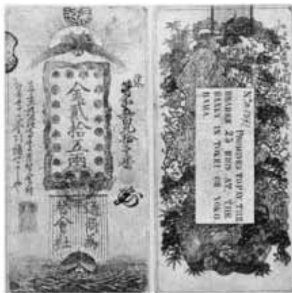
図表-1 横浜為替会社紙幣25両券（表・裏）

なぜこの時代に横浜為替会社が必要とされたのだろうか。その事情は、横浜の時代背景と密接な関係がある。ここで横浜為替会社がどのような歴史・経過を辿ったのか、年表にしたがって見てみたい。年表では、明治元年から明治5年までを表示している。明治2年の2月に設立宣言が行われているが、実際に横浜為替会社が成立したのは明治2年5月16日である。横浜為替会社が活動を始めるのが7月であり、上述のように10月には貨幣発行を行うことになる。全国7カ所の為替会社から、総額で634万両が発行される。東京と横浜では、10月8日に金券25両と1両が発行されるが、横浜為替会社だけは特別に11月に、貿易に使用されるための洋銀券の発行を願い出て、明治3年に発行を認可される。そして、4月に100ドル券と10ドル券を発行することになる。洋銀券発行が行われたのは、為替会社のなかでは唯一横浜為替会社だけであり、この点