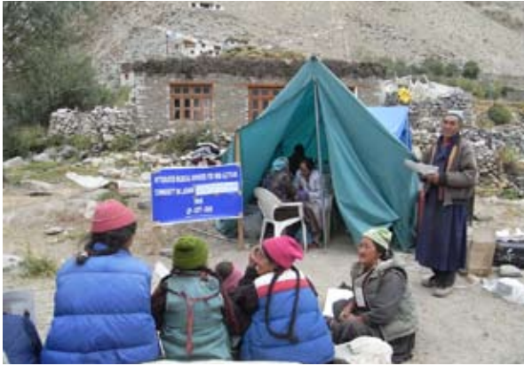
写真1-3 ドムカルにて、LIPのスタッフがテントの中で採血を行う。

採血は、Ladakh Institute of Prevention (以下、LIP) に所属する医療スタッフによって行われた(写真1-3)。LIPからは、医師1名、看護師・検査技師5名が参加し、加えて、通訳や健診補助スタッフ、キャンプの炊き出しをする料理人など、総勢20名をこえるスタッフによって医学健診は運営された。