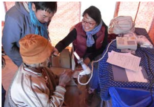
写真1-2 ドムカル谷（3000～3800m）でのメディカルキャンプ。呼吸機能検査の様子。