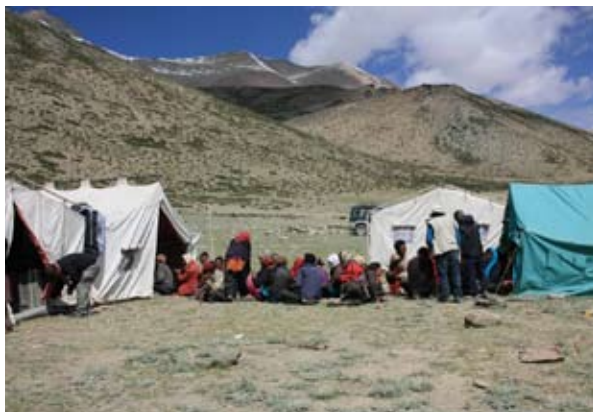
写真1-1 医学調査を行った最標高地点、チャンタン高原のルプシュ（4900m）。健診用のテントに、長い行列ができる。

健診は、各地で40歳以上の住民を対象に行った。検査項目は、血液検査、体重・身長測定、血圧測定、心電図検査、心臓超音波検査、呼吸機能検査に加え、日常生活や心理的健康度（うつ傾向、Quality of Life）に関する問診、栄養問診を行った（写真1-2）。さらに、60歳以上の高齢者を対象に、運動機能測定（握力、歩行テスト、バランステスト）、認知機能検査、日常生活動作に関わる問診を行った。血液検査のための採血は、早朝空腹時の状態で行った。血液検査は、一般血液生化学（ヘモグロビン、アルブミン、LDLコレステロール、HDLコレステロール、中性脂肪、尿酸、血糖値、HbA1C）、酸化ストレスマーカーについて行った。酸化ストレスマーカーには様々な物質が利用されているが、本調査では血清中のd-ROMs（dia-cron-reactive oxygen metabolites）を測定し、体内の細胞酸化状態を評価した。これらの検査に加え、医師の診察を行い、参加住民への検査項目の説明も行った。